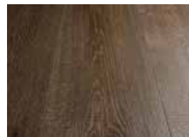
Effetto taglio sega